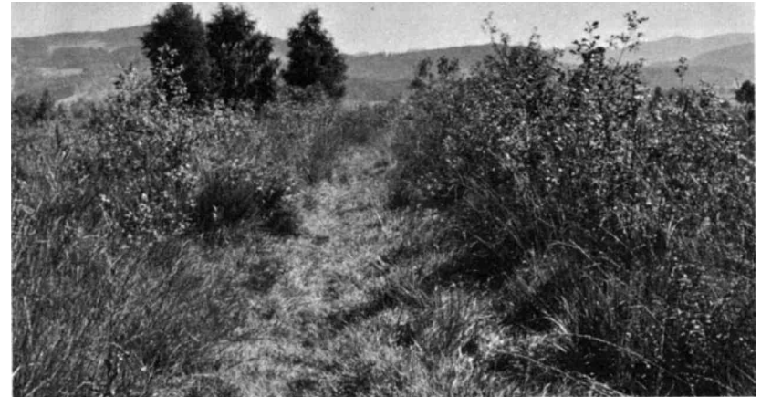
Werden die Riedparzellen nicht mehr gemäht, so verholzen sie im Laufe der Zeit unweigerlich.

muss der Fichtenhag nördlich der Ferienhäuser beim Strandbad «Baumen» bezeichnet werden. Dieser ist vor ca. 35 Jahren gepflanzt worden und hat eine ansehnliche Höhe und Dichte erreicht. Als gradlinige Formation im freien Gelände wirkt der Hag landschaftsfremd und hemmt die freie Sicht auf den Schilfsaum und das Ufer. Diese Angelegenheit wurde mit den Grundeigentümern eingehend beraten. Eine im Jahre 1944 erteilte Konzession der Baudirektion zur Erstellung von Bootsstegen bei diesen Liegenschaften ist abgelaufen und muss erneuert werden. Wenn durch eine bessere lockere Bepflanzung an der oberen Grenze der Liegenschaften eine schönere landschaftliche Gestaltung mit freien Durchblicken auf den See ermöglicht wird, so könnten die Bootsstege als privates Privileg weiterhin im öffentlichen Seegebiet toleriert und evtl. der Schilfgürtel längs dieser Liegenschaften abgesperrt werden. Dies würde auch im Interesse des Vogelschutzes liegen.