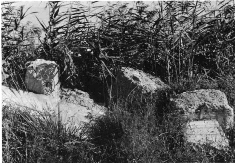
Ablagerungen jeglicher Art verschandeln die Landschaft und zerstören den Schilfbestand.

weist einen guten Bestand auf und die Überwachung des Schutzgebietes erweist sich als unbedingtes Erfordernis. Das zeigten die verschiedenen Verzeigungen, die auch im letzten Jahr nebst unzähligen Belehrungen notwendig waren. Es ist vorgesehen, die Aufsicht über das Schutzgebiet nach verschiedenen Richtungen noch besser zu organisieren. Dies ist vor allem hinsichtlich der schweren Eingriffe in diese Naturlandschaft, die immer wieder festgestellt werden müssen, not-