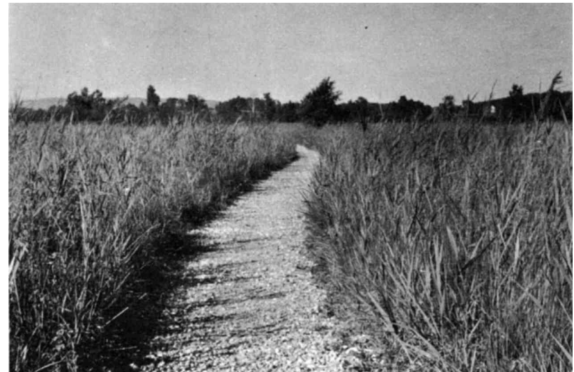
Der gleiche Weg im ausgebauten Abschnitt. Die Ordnung in der Landschaft wirkt sich auf das Verhalten des Besuchers aus.