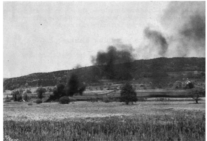
Dieser Brandplatz konnte nach längeren Bemühungen verlegt werden.

Als ein wesentlicher Erfolg darf die Verlegung des Brandplatzes der Firma AG R. & E. Huber, Pfäffikon, gewertet werden. Durch das Entgegenkommen der Gemeinde war es möglich, vorläufig einen andern Platz ausfindig zu machen. Sobald eine endgültige Lösung gefunden ist, wird das bisherige Areal wieder der Umgebung angepasst. Der Firma AG Huber und der Gemeinde Pfäffikon gebührt für die Bemühungen der beste Dank.