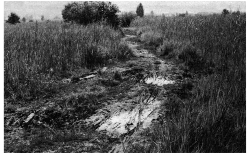
Der nicht ausgebaute Moorweg wird immer breiter, die Riedvegetation wird zerstört.