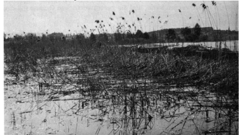
Monatelanger hoher Wasserstand schädigt den Schilfbestand und macht die Wanderwege unpassierbar.