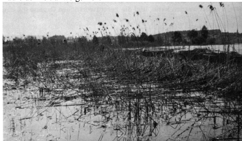
Monatelanger hoher Wasserstand schädigt den Schilfbestand und macht die Wanderwege unpassierbar.