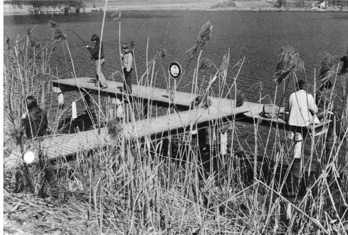
Im Gegensatz zu den soliden Fischerstegen an anderen Seen (z. B. Türlensee) sind diese am Pfäikersee überaltert und müssen ersetzt werden.

Zu den der Öffentlichkeit zugänglichen Einrichtungen im Schutzgebiet gehören auch die Fischer- und Bootsstege. Zuzufolge Alterung, Eisdruck, böswilliger Demolierung sind die seinerzeit im Frondienst erstellten Fischerstege heute in einem unbefriedigenden Zustand. Sie wurden dieses Jahr durch die Sportfischer notdürftig repariert. Im Zusammenhang mit der Erneuerung der Konzession durch den Kanton wird abgeklärt, welche Anzahl Fischerstege, an welchen Standorten und in welcher landschaftsgerechten und möglichst dauerhaften Bauart die Stege zu ersetzen sind. Zusammen mit der Strandbadkommission wurde bereits auch die Verlegung des Motorbootsteges aus dem Badebereich geprüft, da der jetzige Standort zu wenig unfallsicher ist.