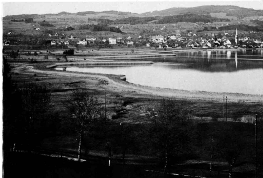
Westufer des Pfäffikersees und Giwizenried, Aufnahmen 1928 und 1963 (aus Landschaftspflegeplan Pfäffikersee).

Das Riedgebiet rund um den Pfäffikersee ist aufgeteilt in mehr als 700 einzelne Parzellen, von denen über 450 unvermessen im Robenhauserried liegen. Zum grössten Teil werden die Grundstücke von den rechtmässigen Eigentümern seit Jahrzehnten nicht mehr genutzt und verbeschen im Verlauf der Zeit. Ein typisches Beispiel ist das Giwizenried, das vor 50 Jahren nur einzelne Bäume aufwies; heute ist zufolge Verbuschung die Sicht zwischen Osterstrasse und See jedoch verdeckt. Ohne Nutzung und Pflege besteht die Gefahr, dass weite Teile des Schutzgebietes diesem Schicksal anheimfallen. Diese Erkenntnis bewog die Baudirektion des Kantons Zürich für die Pflegearbeiten in den Schutzgebieten nicht nur Personal anzustellen, sondern dieses auch mit den notwendigen modernen Maschinen und Geräten auszurüsten. Seit einigen Jahren wird diese Arbeitsgruppe in engem Kontakt mit unserer Vereinigung am Pfäffikersee eingesetzt. Weite Gebiete wurden in harter Arbeit von der Überwucherung gesäubert, und es entstanden wieder, vor allem auch im Berichtsjahr, mitten im Schutzgebiet botanisch und landschaftlich interessante grössere Flächen. Den überzeugendsten Eindruck hinterliessen die Mäharbeiten zwischen Seegräben und Robenhausen, rechts der Aa. Dabei wurde auch die Absturzstelle eines Militärflugzeuges im letzten Weltkrieg und die dortige Gedenktafel freigelegt.