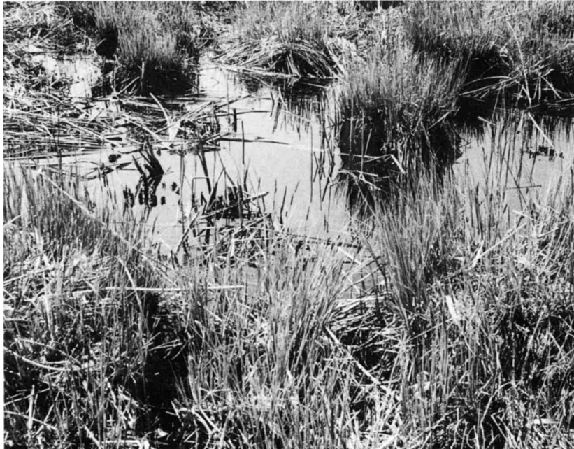
Da die biologisch sehr interessanten Torfstiche immer mehr verlanden, ist die Schaffung neuer Tümpel zu begrüssen.

neuerung des Schilfbestandes zur Diskussion stand, ein allseits akzeptabler Weg ergab sich jedoch nicht. Es ist anzunehmen, dass der Entwurf vom 9. Juli 1975 für ein Zonenreglement für die Regulierung der Seewasserstände als Grundlage für die vom Kanton mit der Aabachgenossenschaft zu führenden Verhandlungen betreffend Abänderung des Regulierregulativs dienen wird. In der vergangenen Berichtsperiode bemühte sich die Aabachgenossenschaft, die Regulierung entsprechend unsern Vorschlägen vorzunehmen, was mit Dank anzuerkennen ist.