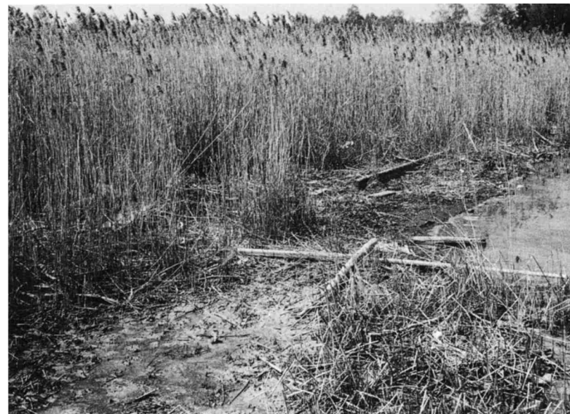
Eine periodische Bach- und Seeuferreinigung ist ebenso notwendig und anzustreben wie ein regelmässiger Reinigungsdienst links und rechts der Wanderwege.

schutzgürtel liegt auch die alte, baufällige Badeanstalt. Die längst dem ursprünglichen Zweck entfremdete Baute ist für die Gemeinde Wetzikon keine Ehre. Nachdem Schneisen im inneren Schutzgebiet seltener geworden und nur noch wenige zu eliminieren sind, entstanden in Richtung See zum Teil neue Durchgänge. Es ist vorgesehen, diese durch zweckdienliche Absperrung ebenfalls auszumerzen. Zur Landschaftspflege darf auch die regelmässige Entleerung der Papierkörbe rund um den See gewertet werden. Bedauerlich ist, dass es immer noch Besucher gibt, die im Schutzgebiet Visitenkarten jeglicher Art hinterlassen und auch bei den Papierkörben das Ziel verfehlen. Ein regelmässiger Ordnungsdienst zwecks Wegschaffung landschaftsstörender Zivilisationsrückstände im ganzen Schutzgebiet ist eine Aufgabe, die noch zu lösen ist. Es betrifft dies nicht nur den Unrat beidseits der vielen Wanderwege, sondern auch Abfälle und Schwemmholz am Seeufer und im Kemptnerbach.