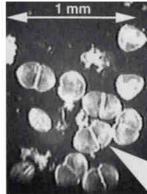
Abb. 5: Muschellarven (Glochidien) der Bachmuschel, mit geöffneten und geschlossenen Schalenklappen