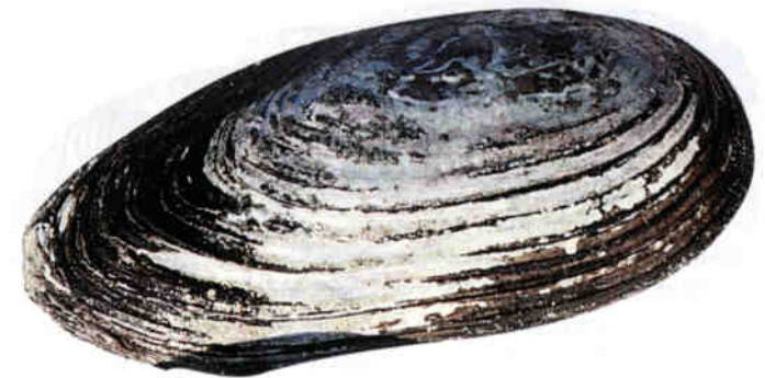
Abb. 1: Linke Schalenklappe einer Teichmuschel Anodonta cygnea aus dem Pfäffikersee. Die Muschel wurde etwa sechs Jahre alt.

Die laufende Untersuchung im Pfäffikersee ergab bisher drei Najadenarten, von denen aber bisher nur noch eine lebend angetroffen wurde: Grosse Teichmuschel, Anodonta cygnea (L.1758), (Abb. 1). Diese Art ist vorwiegend in tiefen Lagen im ganzen Mittelland zu finden und lebt auch im Pfäffikersee. Sie bewohnt die Weichsedimente (Schlamm, Silt, Feinsand) stehender und langsamfliessender Gewässer. In der Schweiz gilt sie als «noch nicht gefährdet» (TURNER et al. 1998).