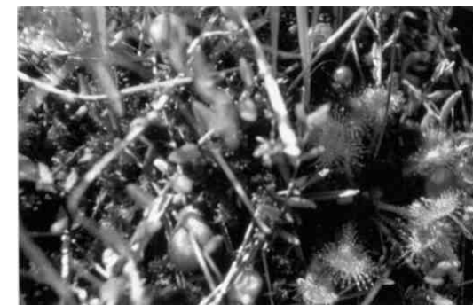
Moosbeere und Sonnentau

Hier wächst der Rundblättrige Sonnentau zwischen dem Geflecht der Moosbeere, welche im Herbst