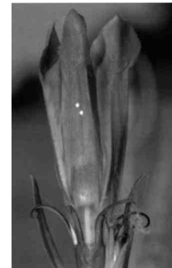
Lungenenzian mit Eiern des Moorbläuling

Der jetzt noch festgestellte Artenreichtum vermag nicht darüber hinweg zu täuschen, dass auch am Pfäffikersee keine idealen und vor allem keine gesicherten Zustände herrschen. Der Besucherandrang wächst, alle möchten um den See, auf den See, in den See, und nur wenige passen sich in Kleidung und Verhalten der Natur an. Leuchtfarben und rasche Bewegung charakterisieren die neuen Trendsportarten, Hektik und Lärm nehmen zu, vor allem in den empfindlichen Uferregionen. Das 1995 erlassene Leinengebot wird von zu vielen Hundebesitzern missachtet. Ehemals scheue Wildtiere wie Krähe