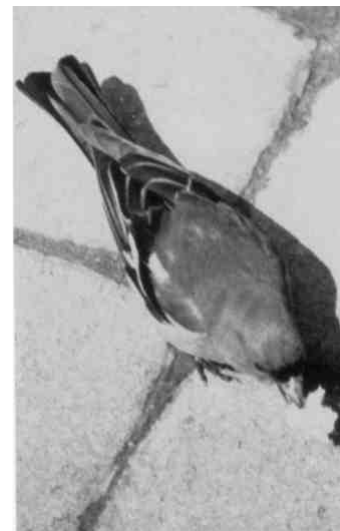
Buchfinkenmännchen (bei Peter Frei)

Gletschern der letzten Eiszeit eingewandert. Im Mai blühen zwischen dem weissflockigen Wollgras verschiedene Orchideen (etwa 15 Arten), Sumpfergissmeinnicht, Kuckuckslichtnelke, Klappertopf und Sumpfhornklee. Der Wegrand im Sommer leuchtet in allen Farben: Weiden-Alant (gelb), Kriechende Hauhechel (rosa), Blutweiderich (purpurrot) und Abbisskraut (hell blauviolett). Dazwischen finden wir die zartrosa Prachtnelke neben dem