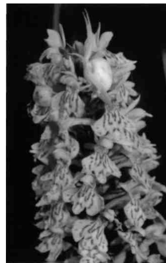
Krabbspinne auf einer Orchis

Mundpartie und den auffallend rundlichen Flossen. Aus Gründen, die von Fach-