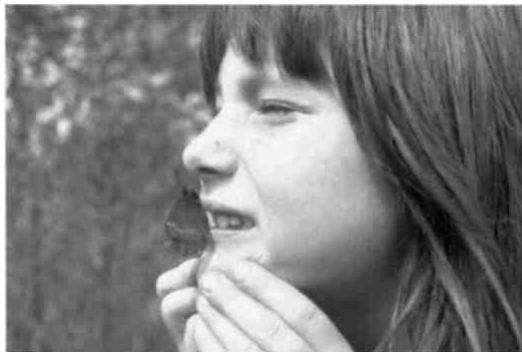
Sich von der Natur berühren lassen! Blauauge auf ungewohntem Landeplatz!

meinde eine Trockenmauer mit vielen Nischen für Kleintiere gebaut. Grossflächige Buntbrachen mit Mohn, Kornblumen und Kornraden erblühen unweit des Kastells. Auf solchen Trittsteinen leben Restpopulationen der Zauneidechse und des Schachbrettfalters, Zugvögel finden einen reich gedeckten Tisch.