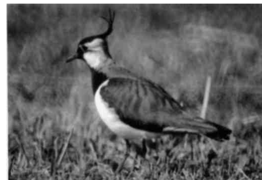
Der Kiebitz kommt früh im Jahr aus dem Mittelmeerraum zurück

Von allen Tieren am Pfäffikersee werden die Vögel am regelmässigsten und genauesten erforscht, gezählt und kartiert. Die Daten kommen von verschiedenen Beobachtern und Beobachterinnen um den See zusammen und gelangen schliesslich über Walter Hunkeler (Wetzikon) an die Vogelwarte Sempach. Der Pfäffikersee ist für die Ornithologen ein Mekka, sie kommen weither gepilgert und kehren nach unvergesslichen Erlebnissen wieder heim. Wenn im März die Kiebitze ihre tollkühnen Balzspiele zeigen, lautstark begleitet durch ein klagendes «Kieh-witt», fällt das auch Laien auf. Sie staunen über die Zutraulichkeit und Schönheit der Allerweltsvögel Buchfink und Kohlmeise im Strandbad Auslikon, welche sich auf der Hand füttern lassen. Drei Viertel