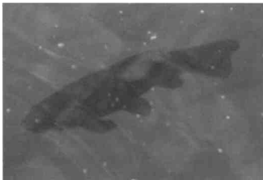
Eine Schleie. dunkle Färbung, rundliche Flossen

Die Sportfischer am Pfäffikersee (es gibt hier keine Berufsfischer mehr) heben den ausgezeichneten Felchen- und Hechtbestand hervor. Der Felchen, vor Jahrzehnten ausgestorben und Mitte Siebzigerjahre wieder ausgesetzt, muss allerdings in der Fischzuchtanlage vermehrt werden, eine Naturverlaichung existiert mangels geeigneter sandig-sauberer Laichplätze im Pfäffikersee nicht mehr. Auch dem Hechtbestand wird mit Zuchtmassnahmen nachgeholfen. Der Raubfisch lauert oft in kapitalen Exemplaren