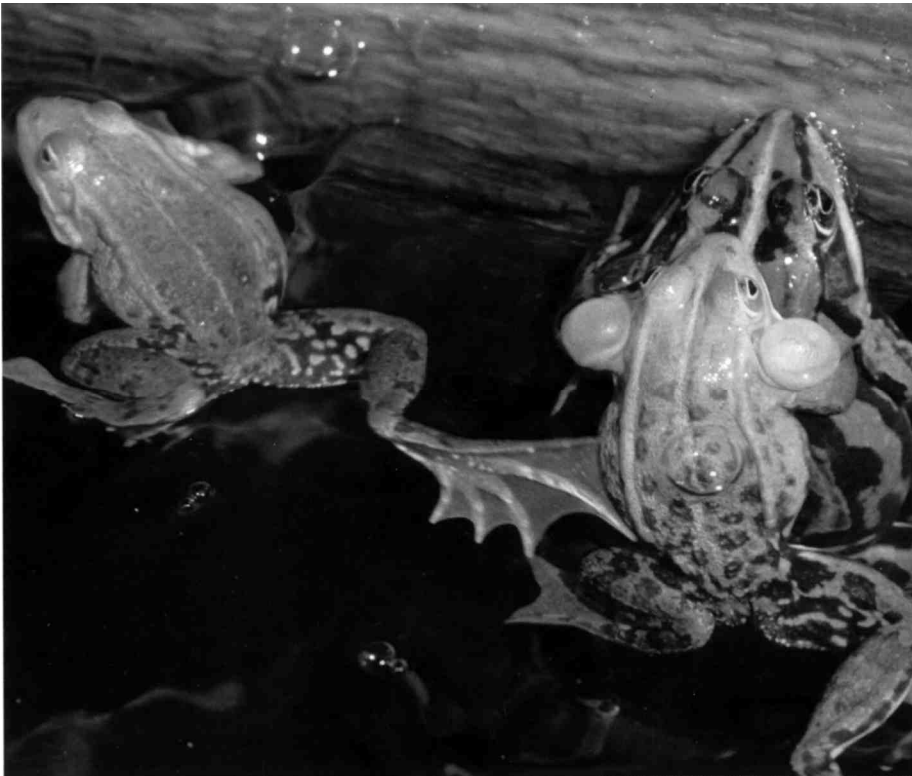
Auf kleinstem Raum sammeln sich die Wasserfrösche

Amphibien sind alle gefährdet, der Schutz ihrer bestehenden Lebensräume und die Schaffung von neuen Tümpeln sind für sie überlebenswichtig!