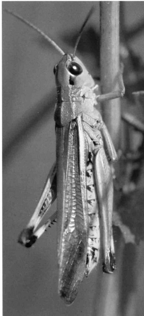
Sumpfschrecke, in Vorbereitung ihres «Schiens schleuderzicks»

Auch wissenschaftliche Namen sind Glücksache: Die Sumpfschrecke nennt sich Stethophyma grossum (L), Die Langfl. Schwertschrecke: Conocephalus fuscus Fabr. Das Heupferd segelt auch gut.