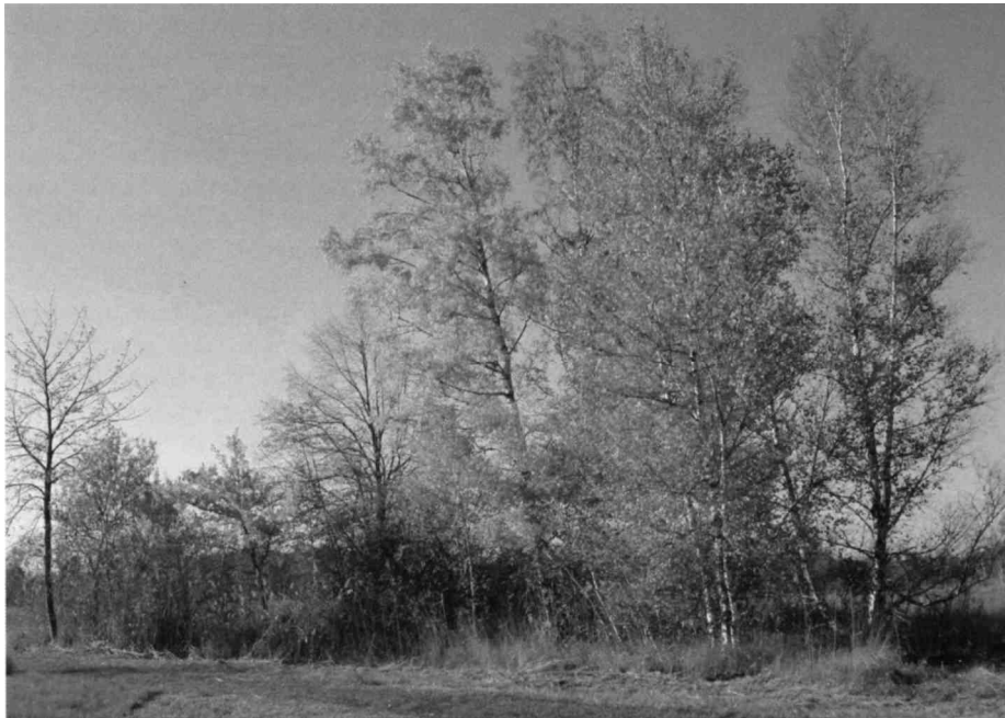
Die vielfältige Baumhecke ist eine Augenweide

Wie helles Gold vor blauem Grund präsentieren sich die Bäume und Sträucher der Gehölzgruppe am Wegesrand. Besonders die dominanten Birken scheinen ihre leuchtend gelben Blätter noch lange behalten zu wollen, während sie die Linde links davon und hinter ihr die Rosskastanie schon längst abgeworfen haben. Ebenso das wohlgestaltete Kirschbäumchen am linken Bildrand und der Gemeine Schneeball, hingegen sind andere kleinere Gehölze wie Weide, Eiche und Faulbaum noch zum Teil bunt belaubt. Der Grünspecht lässt seinen lachenden Ruf ertönen, und dieser wäre noch wohlklingender, hätte man nicht das stetige Brummen von Klein- und Grossflugzeugen sowie Helikoptern im Ohr.