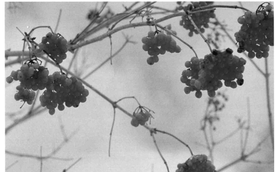
Beeren des Gemeinen Schneeballs