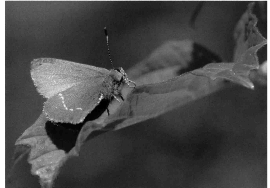
Wie ein Sonnensegel richtet der Brombeerzipfelfalter seine Flügel aus