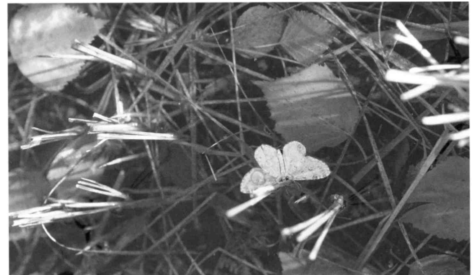
Ein toter Herbstspanner auf der Wasseroberfläche

Das Flachmoor ist zur Zeit überflutet. Die Wasseroberfläche spiegelt das Ried wider, die absichtlich nicht gemähten Schilfstreifen, die Streuhaufen, den sumpfigen Boden und die leuchtend weissen Birkenstämme. Geheimnisvoll dunkel ist der Grund unter Wasser, nur einzelne Birkenblätter, Rhomben mit gesägtem Rand, liegen da. Die Wasserfrösche haben sich längst darunter verkrochen und erwarten den Winter. Auf dem Wasser liegt einem gefallenem Engel gleich ein weisser Nachtfalter. Es ist die Spannerart Oporinia autumnata , welche im wissenschaftlichen Artnamen auf den Herbst hinweist. Die späte Flugzeit dieses grazilen Falters reicht bis in den November.