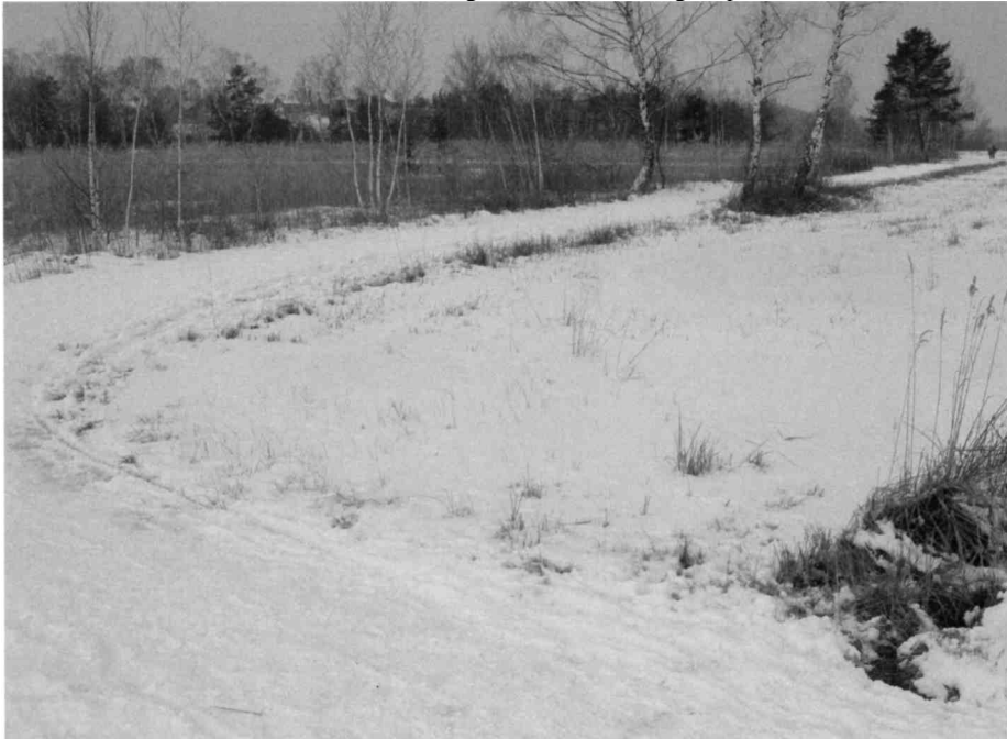
Das Flachmoor im Winter

Durch den Schnee wirkt die Landschaft weit und öde. Er knirscht unter den Schuhen, verschluckt die Geräusche der Zivilisation und vermittelt das Gefühl: Ich bin allein auf weiter Flur. Die Spuren im Schnee zeugen allerdings von den Wanderungen verschiedener Lebewesen: Schuhedrücke diverser Grössen und Profile, daneben die Bahn eines gezogenen Plastikschlittens, Trittsiegel von grossen Hunden und die fast endlose Doppelrille von Langlaufskiern. Der Läufer hielt sich nicht an den offiziellen Weg, was man ihm aber nicht verargen kann, sind die empfindlichen Pflanzen doch durch die hartgefrorene Schneedecke geschützt und die Brutvögel in wärmeren Gefilden. Wie eine Schnur zieht sich die Spur eines einsamen Fuchses zu einem Schilfhäufen, wo vor kurzem eine Maus aufgetaucht und herumgehüpft ist.