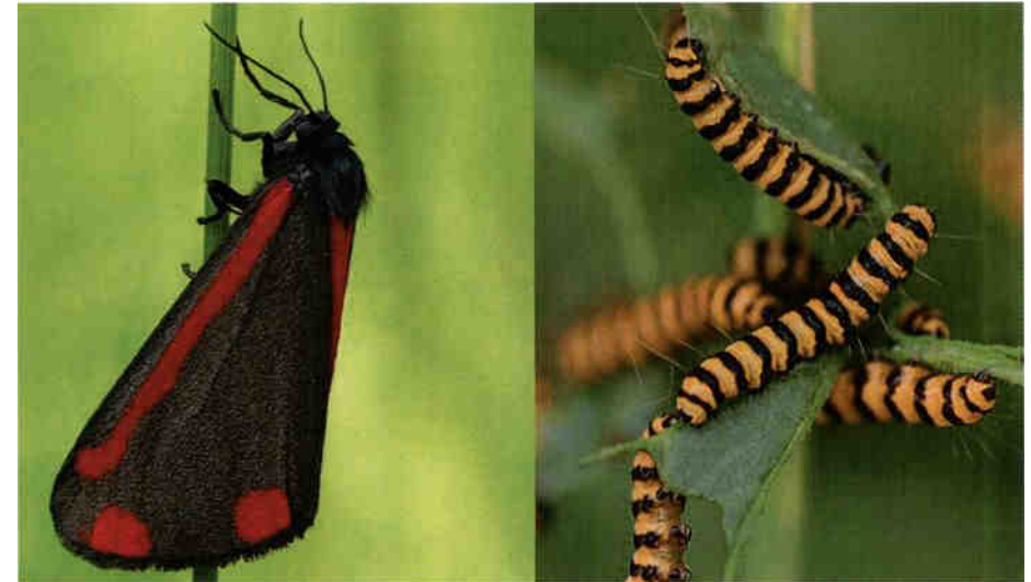
Blutbär ( Thyria jacobaeae ), Schmetterling und Raupen

Bewusst wird im Herbst nicht alles gemäht, damit Kleintiere, vor allem Heuschrecken und Spinnen, einen Teil ihrer Nahrungsgründe, Kinderstuben und Überwinterungsplätze behalten können. Die seltene Grosse Schiefkopfschrecke ( Ruspolia nitidula ), welche in jüngster Vergangenheit am Pfäffiker- und am Greifensee entdeckt wurde, profitiert von den ungemähten Streifen. Ihre langgestreckte schlanke Gestalt wird noch durch den nach vorne gerichteten Kopf und die über körperlangen Fühler betont.